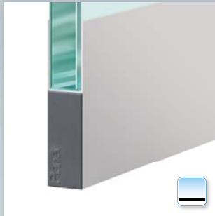
Planet KG-F8 schmal, mit Abdeckplatte