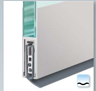
Option: Planet KG-F8 schmal, Schräglippe für wellige Böden