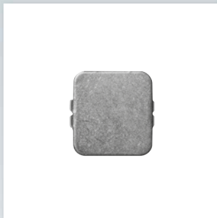
Zubehör: Planet Auflaufplättchen Typ 1 (Edelstahl), 20 x 20 mm