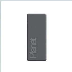
Planet KG Abdeckplatte