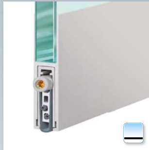
Planet KG-F8 schmal, aufgesteckt und geklebt, Auslösesseite