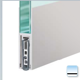
Planet KG-F8 schmal, aufgesteckt und geklebt