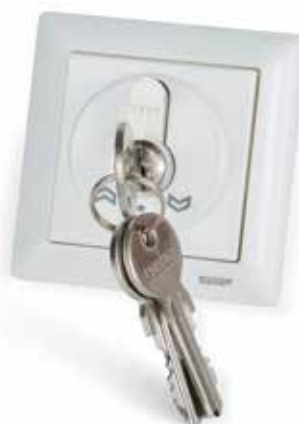
WSA 210 1161