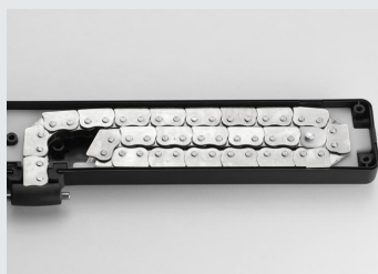
Langer Hub, zusammen mit einem schlanken und attraktiven Gehuse, um Anwendungen zu ermoglichen, die eine minimale Groe erfordern (internationales Patent auf den Kettenweg).