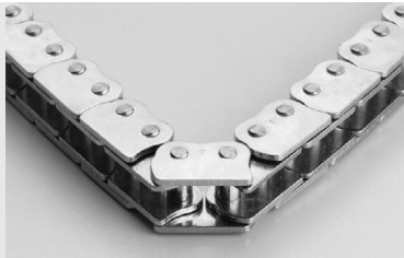
Doppelgliedkette mit sehr hohem Widerstand bei schweren Lasten.